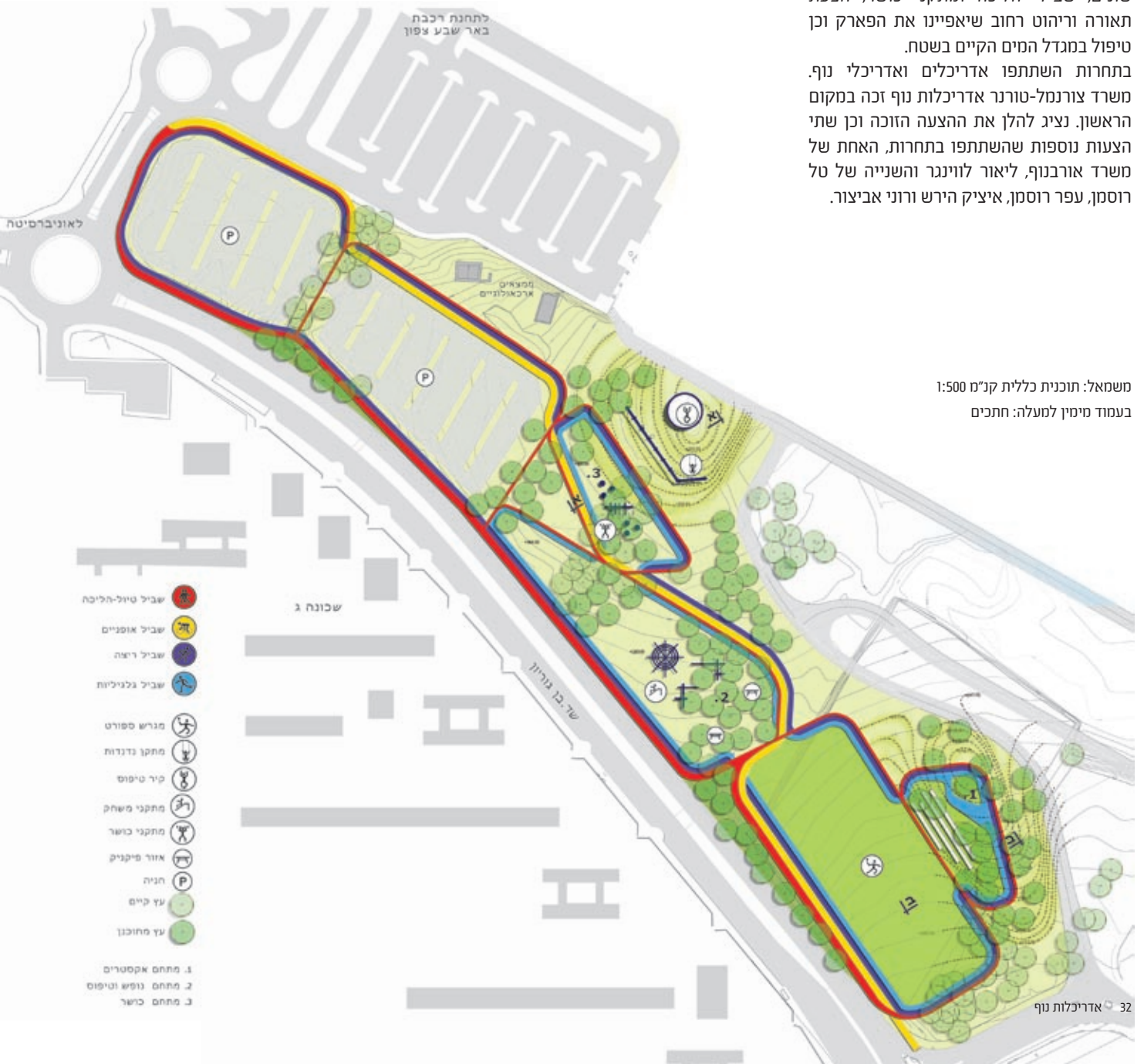
משמאל: תוכנית כללית קני"מ 1:500 בעמוד מימין למעלה: חתכים