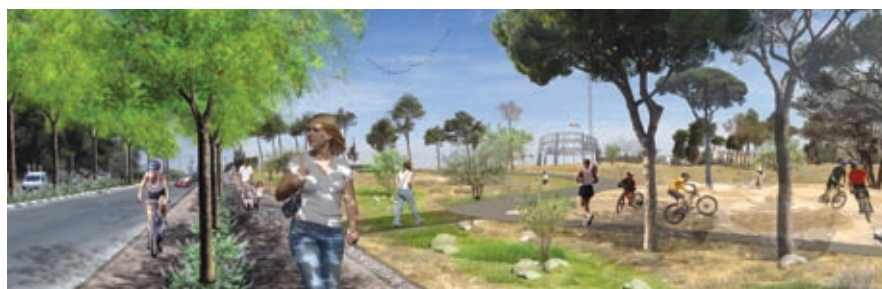
משמאל למעלה: תוכנית כללית של הפארק למטה: פרספקטיבה ראשית

אנו מציעים פארק אקולוגי שמדגיש ומעצים חוויות טבעיות מסוימות (אירועי גשם והצפות יוצרים חוויות מרשימות בכניסות הראשיות לפארק) וממתנות תופעות אחרות (מיתון רוחות באמצעות צמחיה, יצירי פארק המתוכננים כנוה מדבר לינארי).