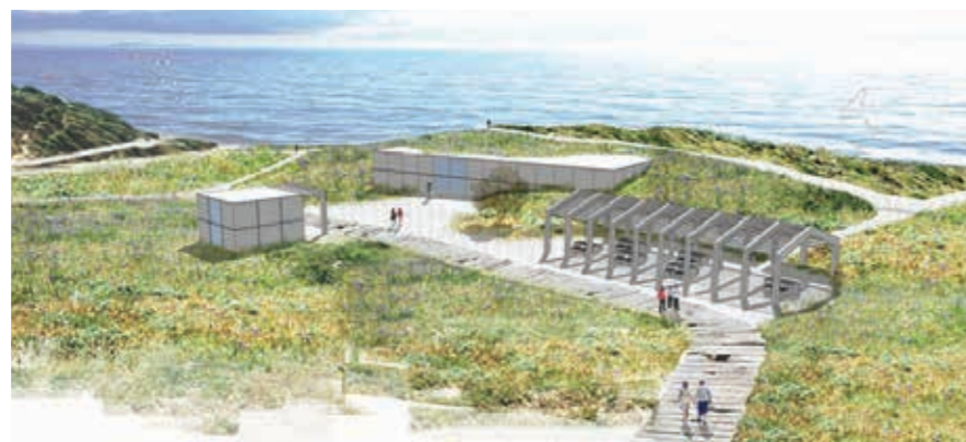
א מרכז טבעירוני - מבסיס נושן למוקד חינוך ומידע כלל עירוני