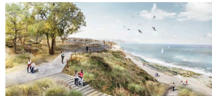
א מבט לסף המצוק החופי