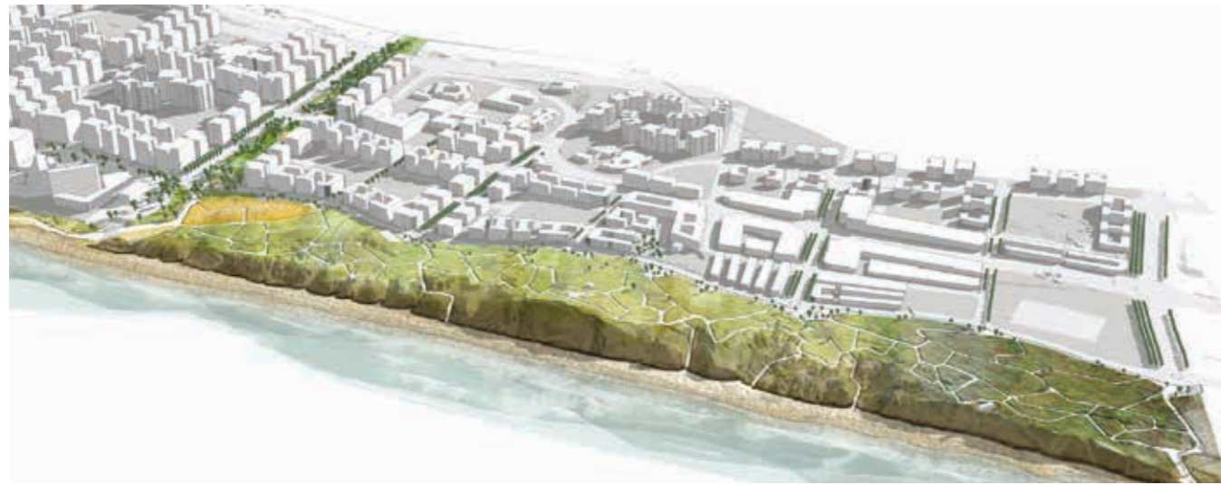
א מבט על ממערב