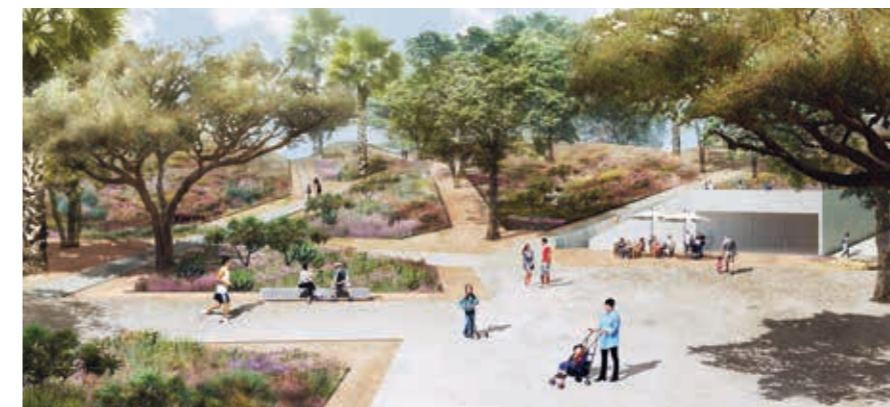
א רחבת כניסה לפארק - מעבר הדרגתי בים עיר לטבע עירוני

קיום // האנושי; הצומח; הדומם; הנוכחים במרחב הפארק והעתידיים לבנות ולהרכיב את מרחב העיר העתידי בצפון-מערב העיר. קיימות // גישה תכנונית המבקשת לשלב בין צרכי הקיום של האדם לאלה של הטבע והבטחת המשכיותם בדורות הבאים.