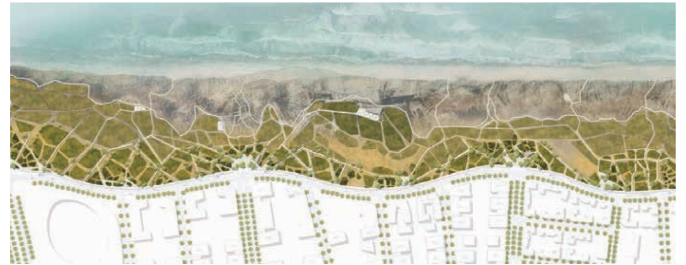
א תכנית כללית