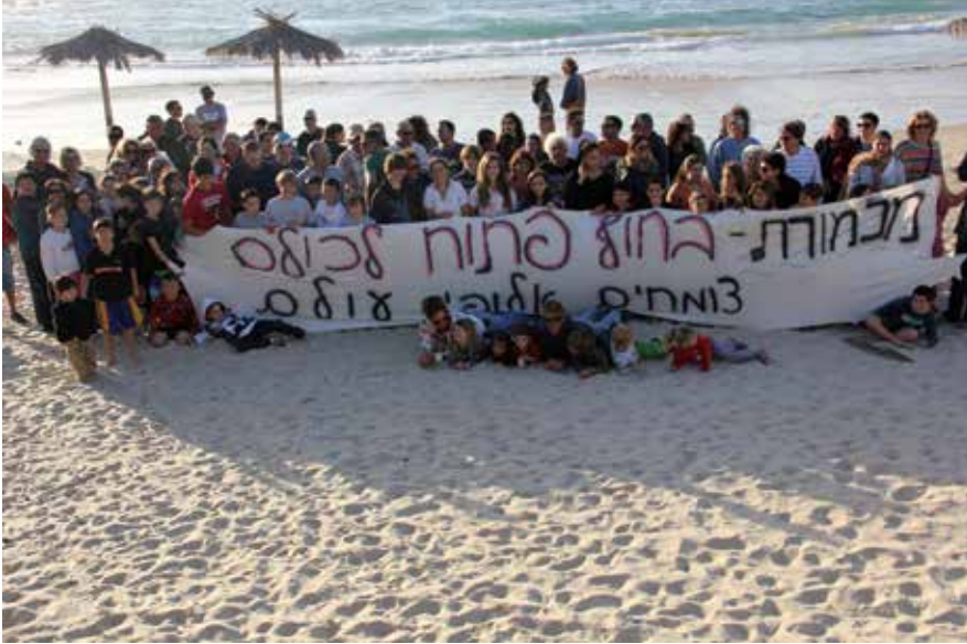
חופי הרחצה אמורים להיות נגישים לכולם ללא תשלום. אחרי מאבק של למעלה מ-10 שנים, כולל עתירות, מאבקים מקומיים ובגז מוצלח, הורה שר הפנים לפתוח את החופים לכלל הציבור. המטרה החדשה היא קביעת המצב הנכחי לטווח רחוק והקטנת התשלום על חנייה.

היותר מדובר בעצירת יוזמות לכמה מגורי יוקרה. אישור תמ"א 1 בממשלה והפיכת היוזמה של משרד התיירות לחוק, עלולה לשנות ללא היכר את דמותה של הארץ. החופים הפתוחים המעטים שעוד נותרו כאן יתכסו במהירות בבטון שישרת, אך ורק אינטרסים כלכליים צרים וישאיר אותנו, הציבור, מתבוסס באספלט.