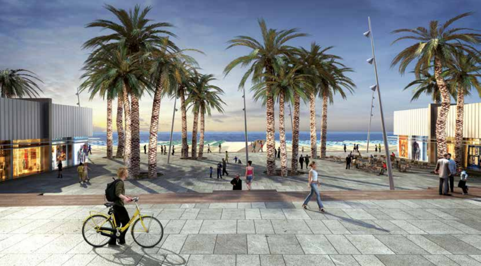
למעלה: טיילת עירונית בחוף הצפוני בעמוד מימין: תכנית אסטרטגית למרחב החוף אשדוד על רקע תצ"א (2013)