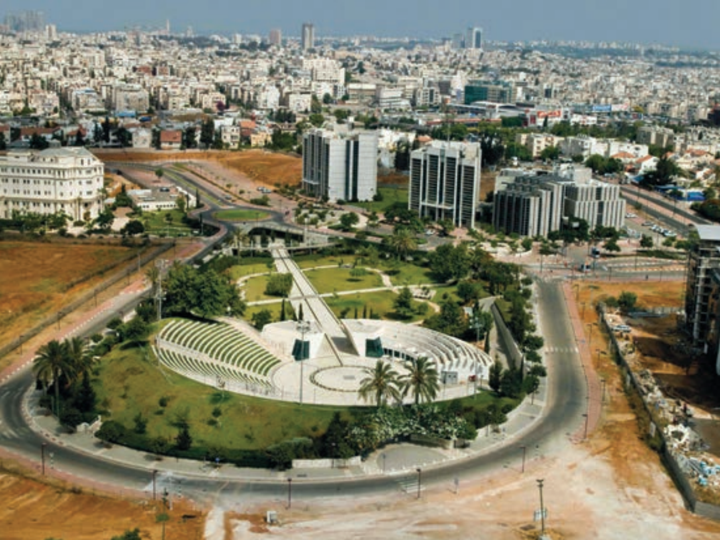
למעלה: תצלום אוויר של פארק דהאן, אוניברסיטת בר אילן למטה: ילדים נהנים מאטרקציית המים בשביל המרכזי, פארק דהאן, אוניברסיטת בר אילן