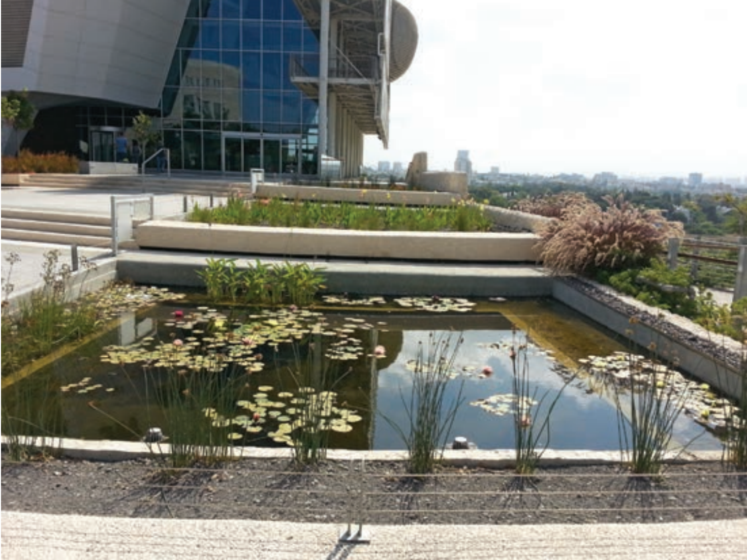
למעלה: בית הספר ללימודי הסביבה ע"ש פורטר - רחבת הכניסה עם הברכות לטיהור מים אפורים, כחלק מהמרחב הציבורי. צילום: ברויזא מעוז אדריכלות נוף למטה: תכנית הפיתוח הנופי סביבית סביב בית ספר ללימודי הסביבה ע"ש פורטר

כשלושה דונם בה יכול כל עובר אורח הצועד לאורך הטיילת, או רוכב על אופניים, לעצור, לשבת, ליהנות מעצי הצל ומבריכת הנוי ולהתבונן על הנוף המרהיב.