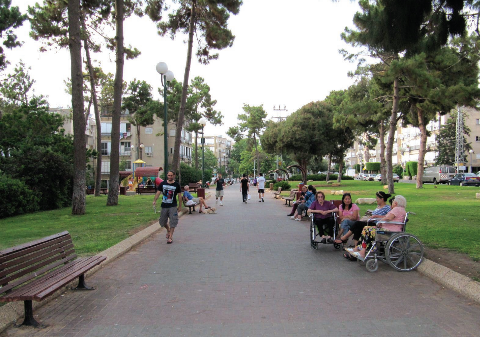
שדרות דניאל בבת-ים, דוגמה לשילוב טוב בין מרחב תנועה למקום חברתי ובין רחבה ציבורית ושצ"פ ירוק

מתפיסה זו יש להפנות את עיקר ההשקעה בגינון ציבורי וייעור העיר לרחובות, שבהם הולכים ונמצאים רוב האנשים - וזאת על ידי הכפלה ואף שילוש כמות העצים ברחובות כך שייצרו צל המשכי, בעיקר ברחובות הראשיים והרחבים יחסית, שבהם הבניינים אינם יכולים להצל על המדרכות. כמו כן ניתן להוסיף ברחובות מקומות לישיבה, ריהוט רחוב, ואף מתקני משחק.